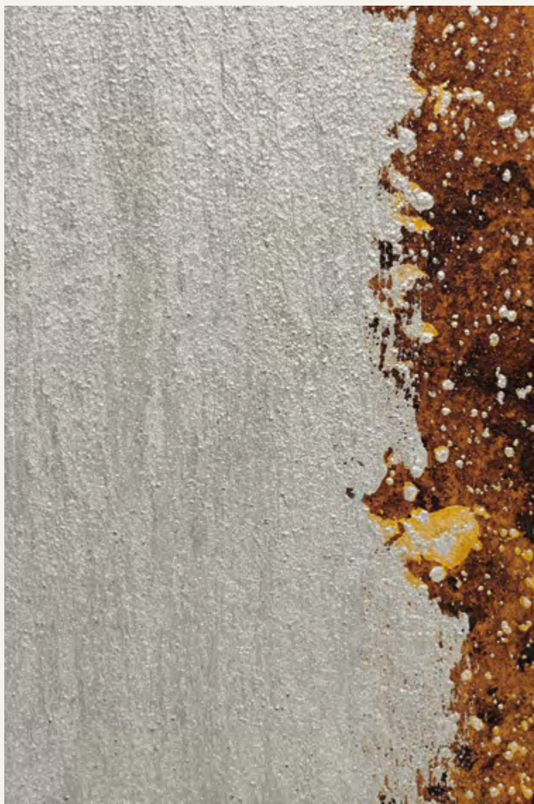
Zeus Silver & IRONic & Clear Finish Glossy

A combination of oxidation and metallic shades achieved with a mix of IRONic and Zeus.