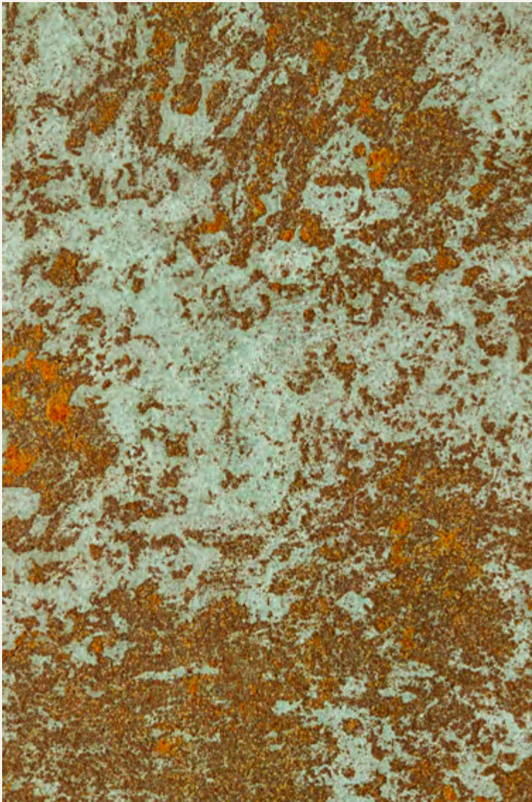
VERDERAME_Wall Painting & IRONic

The ancient structures of old cities with the beauty of copper and its vibrant oxidation.