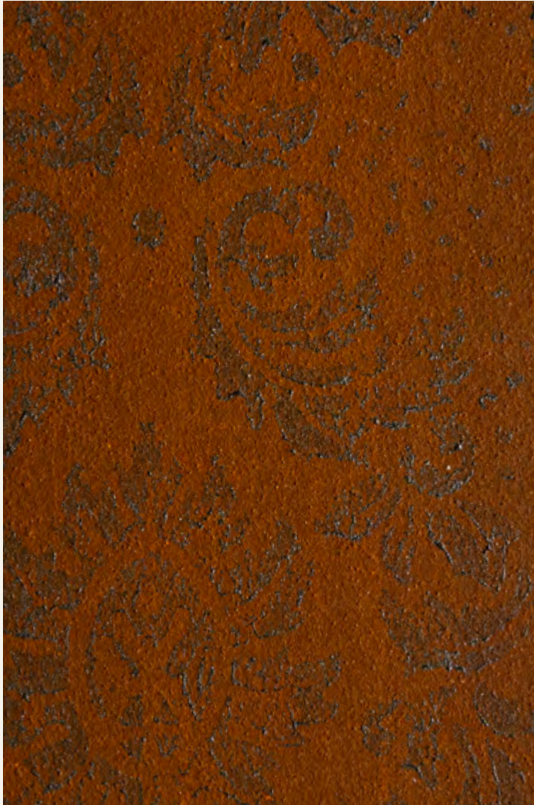
IRONic & Africa Asmara A314

A combination of metal and rust. The oxidation is produced with the application by stencil of Africa on the IRONic wall.