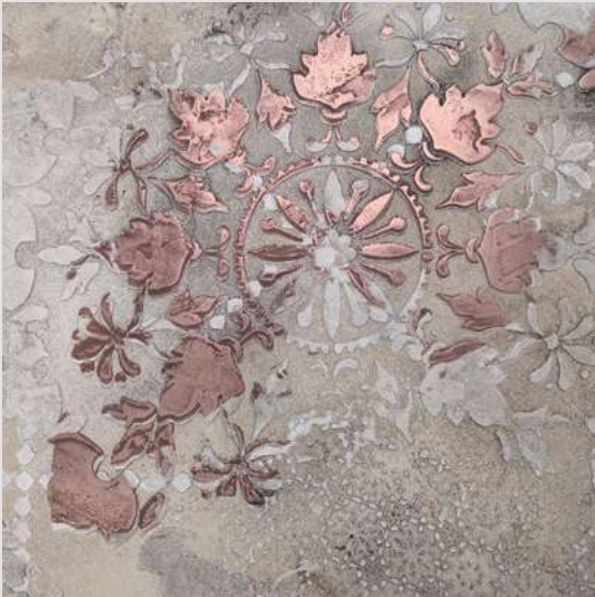
METALLO_FUSO & CALCECRUDA

Metallo_Fuso confère une élégance rare à tous les environnements. Sa combinaison avec un produit comme CalceCruda produit des effets raffinés qui embellissent les espaces.