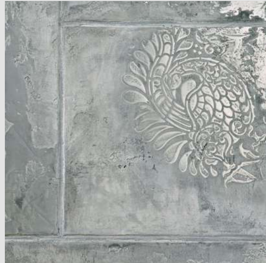
METALLO_FUSO & ARCHI+ CONCRETE