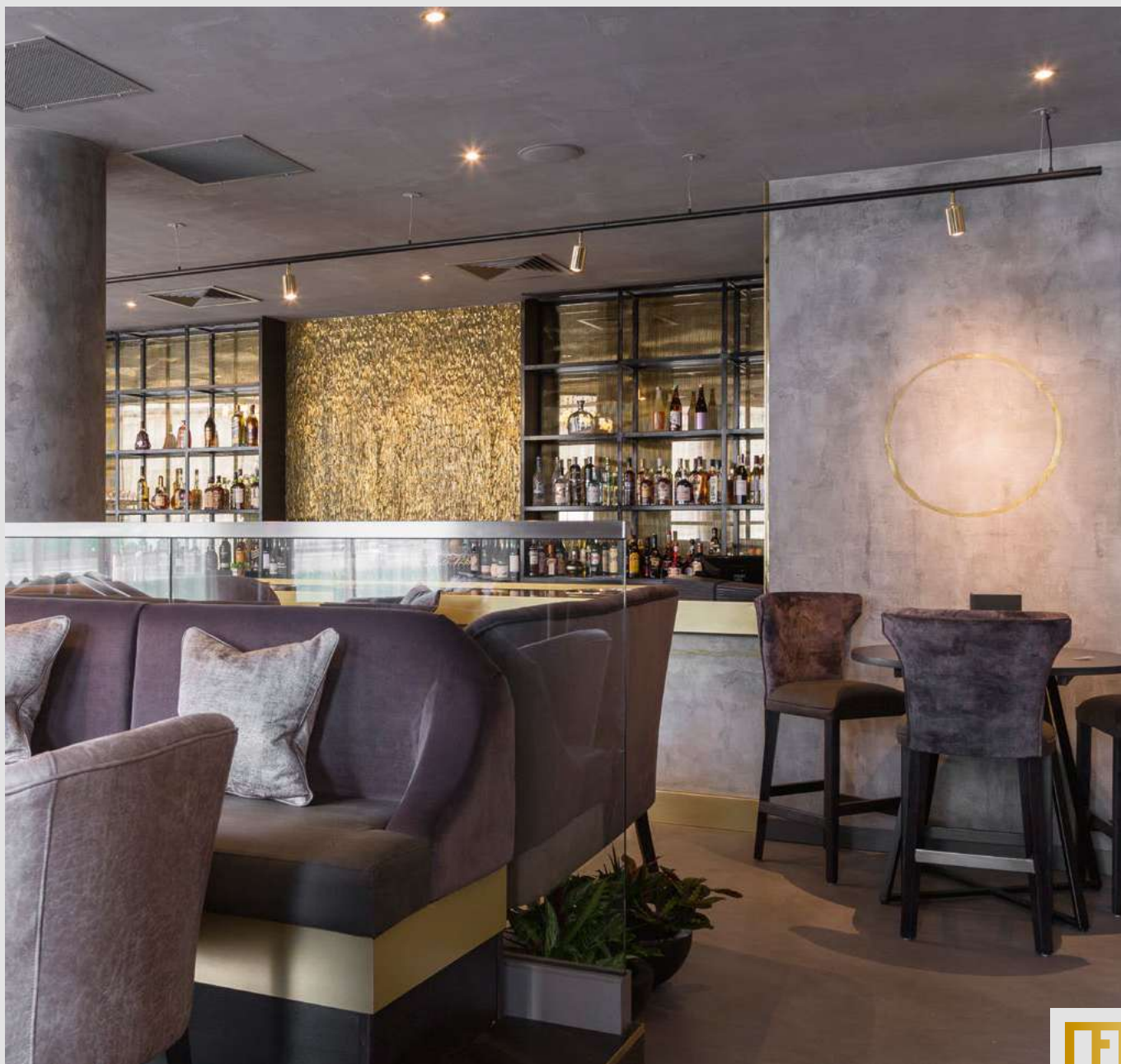
METALLO_FUSO & ARCHI+ CONCRETE - OPHEEM RESTAURANT, UK by Marmo Designs - Partner: Stucco & Stucco - Designer: Tibbatts Abel