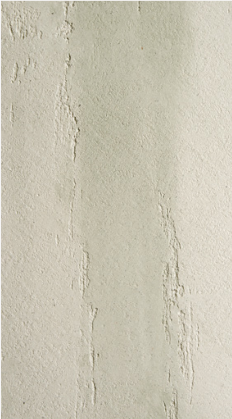
ARCHI+ CONCRETE MKS 20140 & MKS 20151